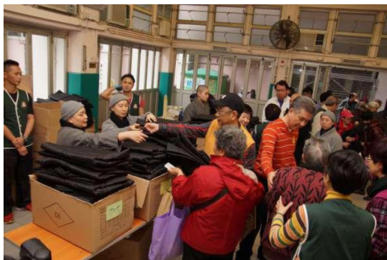
法師及義工們派發寒衣予長者