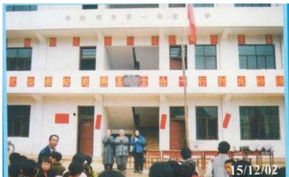
新建成小學盼能收生三百多名