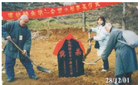
傳般法師為建校帶領動土儀式