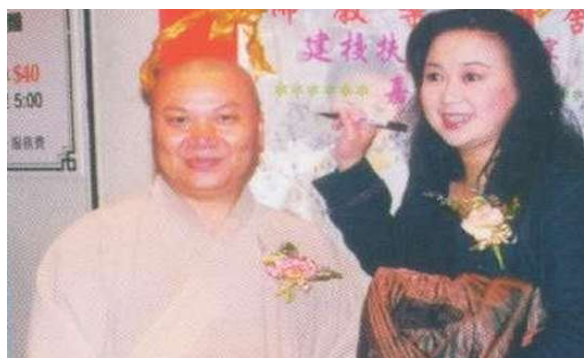
影視紅星朱咪咪應邀出席表演為建校籌款